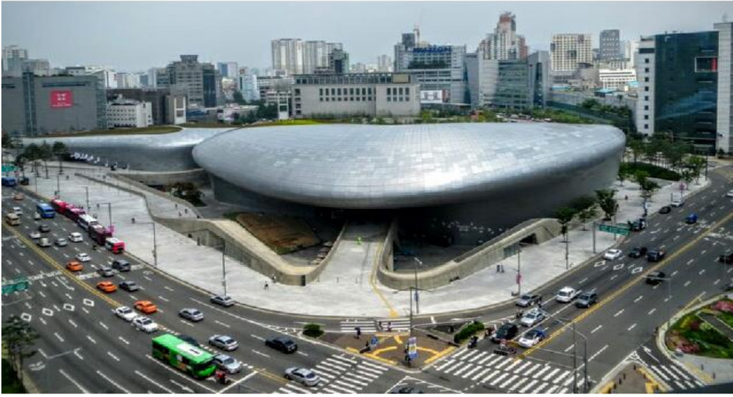
Seul Gezilecek Yerler

Dongdaemun, Seul'ün büyük alışveriş bölgelerinden biri. Ayakkabı, aksesuar, elbiseler, elektronik eşyalar, oyuncaklar gibi akla gelen gelmeyen her şeyi burada bulmak mümkün. Dongdaemun Market 24 saat açık. En hareketli saatlerini gece geç saatlerde yaşıyor. Dongdaemun'un akşam pazarı çok ünlü. Öğleden sonra hareketlenmeye başlayan caddeler, gece geç saatlerde çok kalabalık oluyor. Dongdaemun Design Plaza, uzay gemisine benzeyen ilginç görünümüyle görenleri hayrete düşürüyor. Özellikle gece ışıklandırmasının görülmeye değer olduğu belirtiliyor.