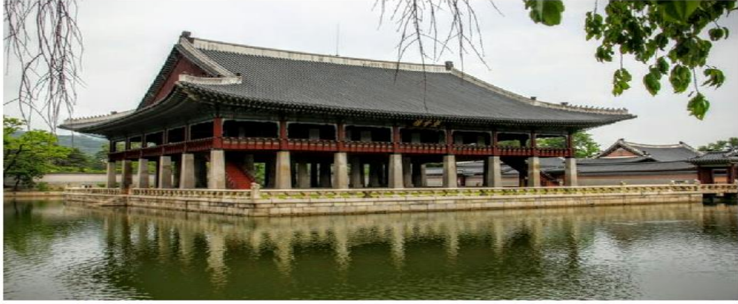
Seul Gezilecek Yerler

gereken yerler arasında ilk sırada yer alıyor. Gyeongbokgung Sarayı Unesco Dünya Mirası koruması altında alınmış. Sarayın içinde Kore Kültürü hakkında bilgiler veren iki müze de bulunuyor.