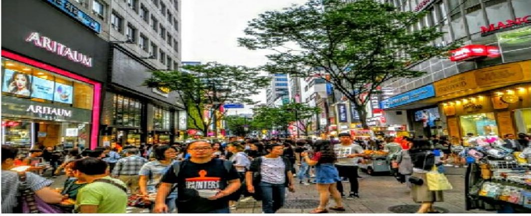
Seul Gezilecek Yerler