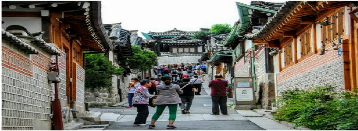
Seul Gezilecek Yerler

Gyeongbokgung Sarayı'nın hemen yanında bulunan bir bölge. Eski Kore kültürü Bukchon Hanok Köyü'nde yaşanabiliyor. Evlerin içi de ziyaret edilebiliyor. Kore'de aynı bizdeki gibi evlerin içine girerken ayakkabı çıkartılıyor.