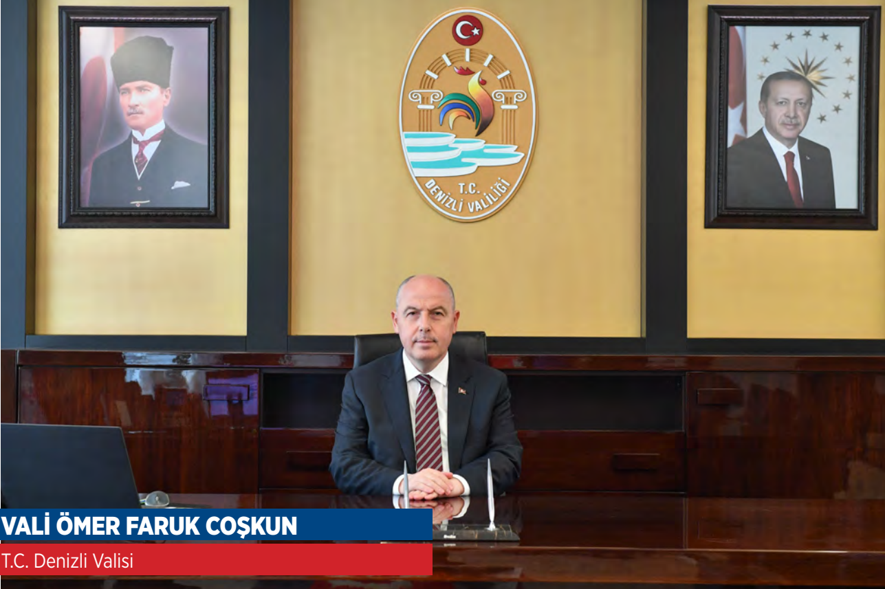
VALİ ÖMER FARUK COŞKUN